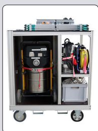
Wap SQ 650-71 Wasserauger