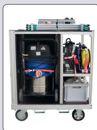
Nilfisk Alto Wasserauger