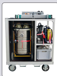
Wap Turbo M2AE Wasserauger