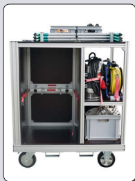
RC-HW2 mit Möglichkeit zur Verlastung von 3 unterschiedlichen Saugern.